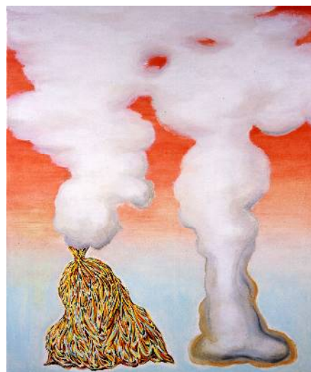
長谷川繁《ビニール袋・キノコ(雲)》 2010年、油彩・キャンバス、当館蔵

*10月は通常プログラムの代わりに、10月10日(月・祝)、谷山恭子公開制作ワークショップ「お気に入りの風景を集めて、手のひらに乗せてみよう」(事前申込制)があります。