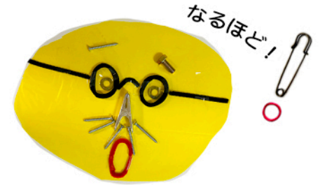
びっくり顔のびっくりさん

おもくて、顔とずれてしまう場合は、 わゴムを2こ、つかったり、 ヘアゴムをつかうと、うまくいくよ！