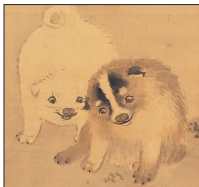
円山応挙 時雨狗子図