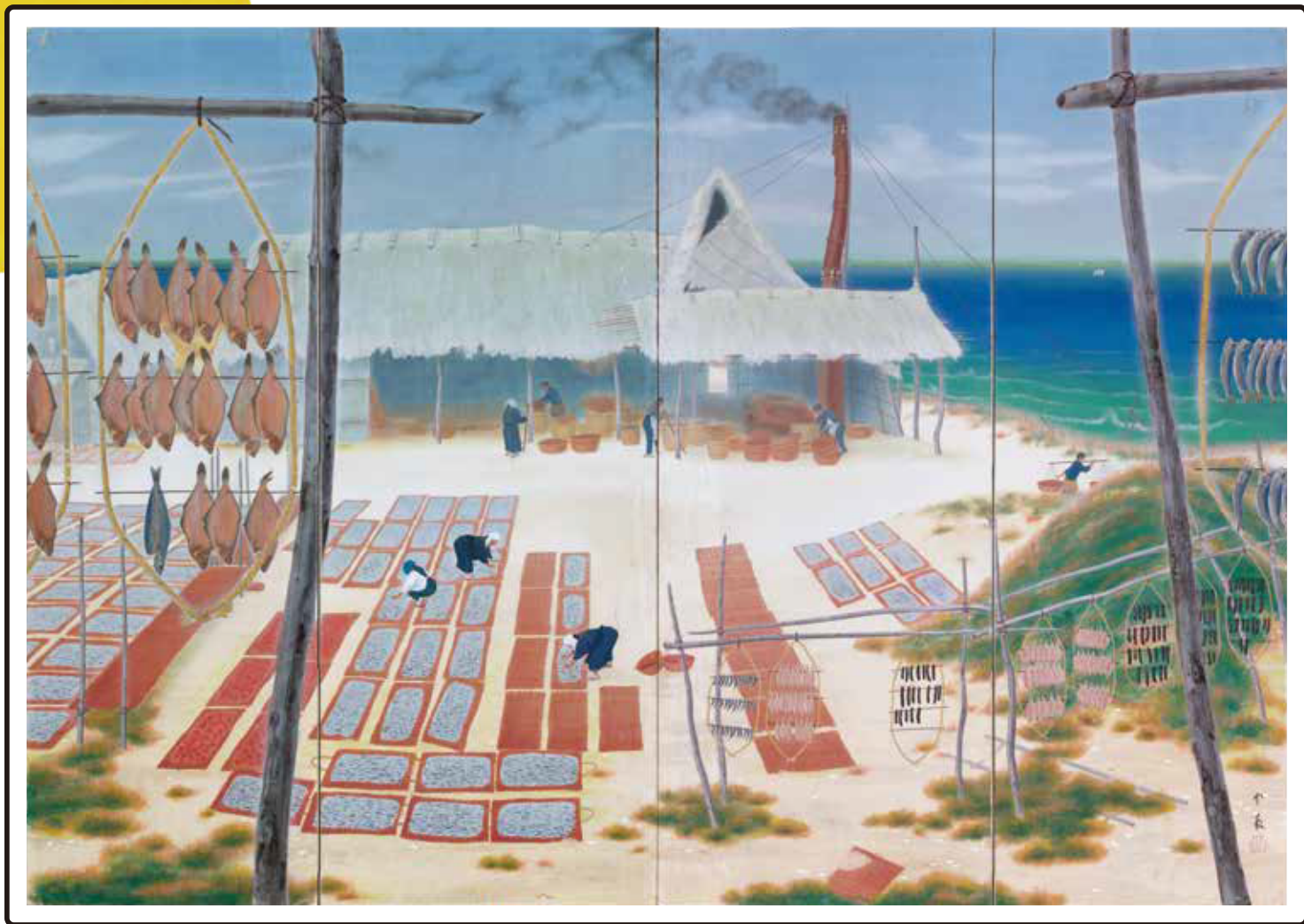
堂本印象『浜の幸』府中市美術館蔵