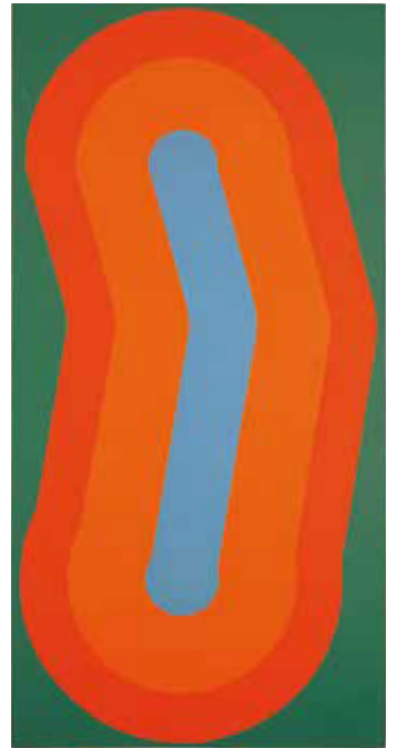
阿部展也《R・13》昭和45年(1970)