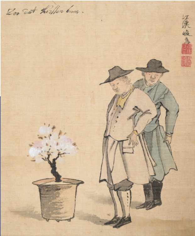
司馬江漢《健人観桜図》江戸時代中期(18世紀) | 当館蔵 SHIBA Kokan, Dutchmen Viewing Cherry Blossoms , mid-Edo period (18th C.), Fuchu Art Museum