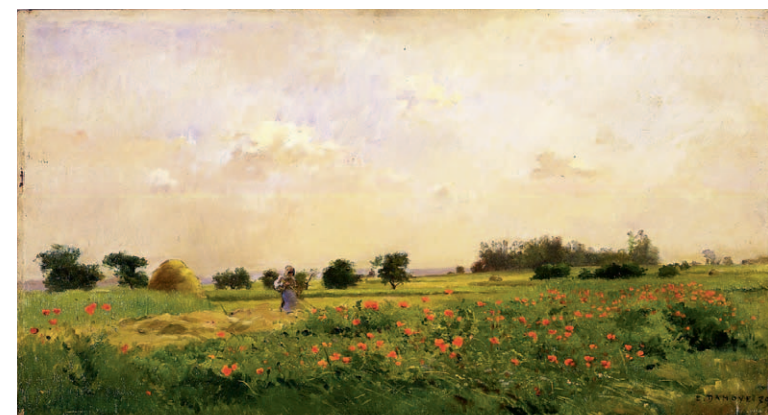
ピエール=エマニュエル・ダモア《コクリコの畑》1879年 当館蔵 Pierre-Emmanuel Damoye, "Field of Corn Poppies", 1879, Fuchu Art Museum