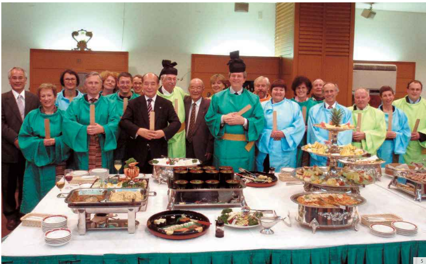
ヘルナルス区友好訪問団の府中滞在時