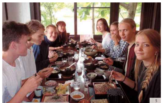
ヘルナルス区派遣生の府中滞在時