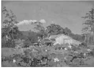
▶ Alfred Parsons: A Tea House at Kamakura, Koriyama City Museum of Art collection