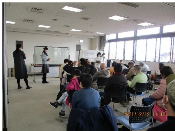
<コース別活動> 話し合い風景