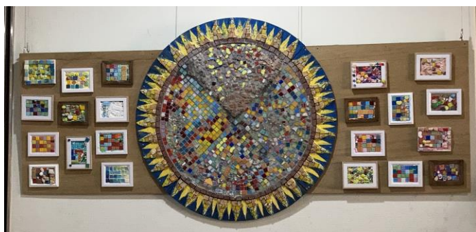
「第29回府中市生涯学習フェスティバル 市民作品展出展」に出展