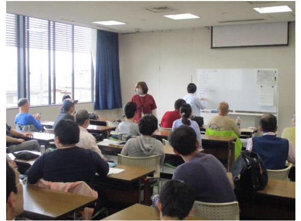
＜コース別活動＞ 話し合い風景