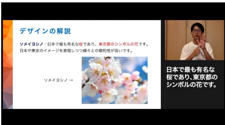
学生によるデザイン説明(動画)