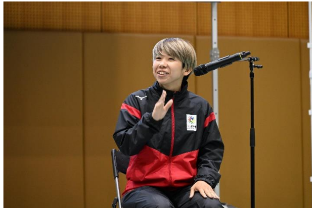
デフアスリートトークセッション(岩淵 亜依選手)