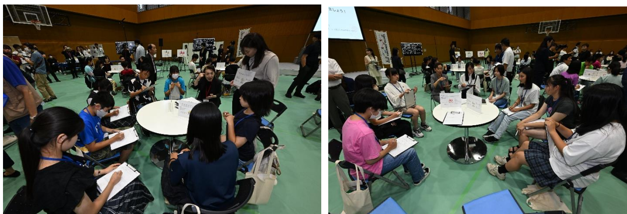
グループワーク中の様子