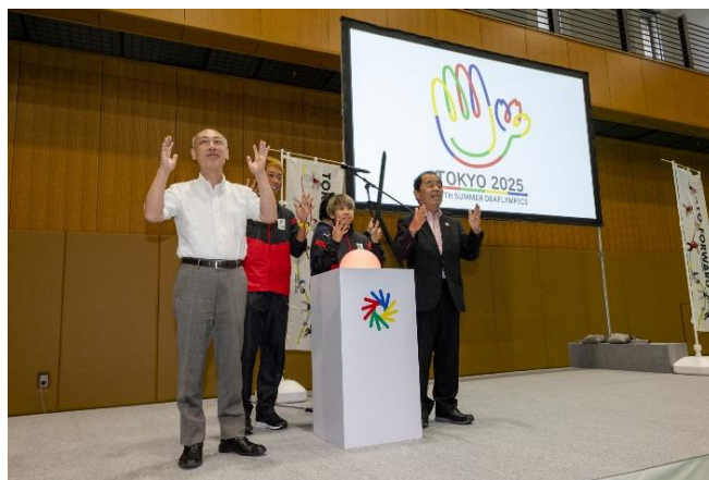
大会エンブレム決定・発表