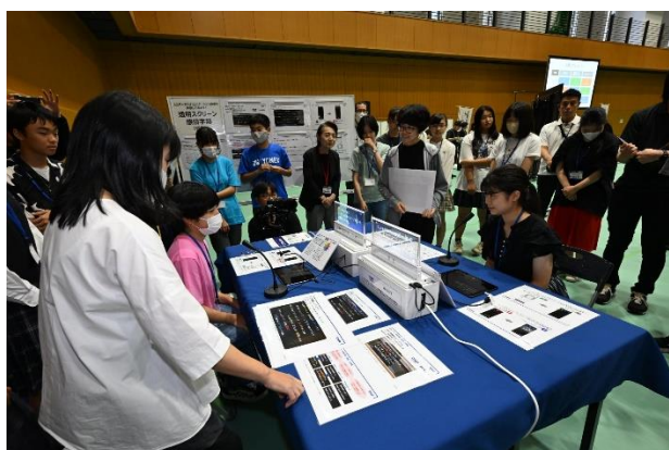
透明スクリーン感情字幕(仮称)の体験