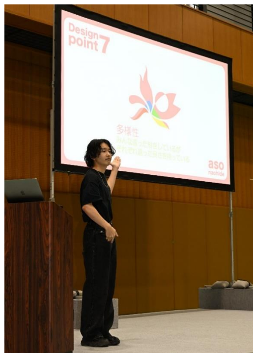
学生によるデザイン説明