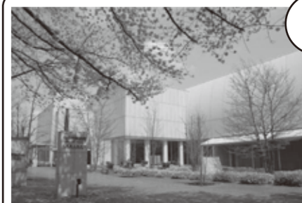
— 府中市美術館 —

美術作品とともに四季折々の自然も楽しめる美術館です。1階のスペースは、入館無料、自由に出入りできて、カフェも併設されているので、お散歩のついでにふらっと寄り道できるようなオープンな雰囲気です。お年寄りや障害者にも配慮された設計になっています。