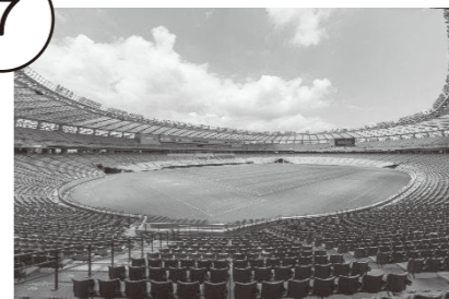
— 味の素スタジアム —

約5万人を収容できるスタンドがあり、サッカーやラグビー、コンサートなど様々なイベントが開催されています。