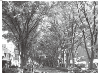
— 馬場大門のけやき並木 —

1062年、源頼義、義家父子が、前九年の役の戦勝祈願御礼としてけやきの苗1,000本を寄進したことに始まると言われています。その後、徳川家康が関が原、大坂両役の戦勝の御礼として馬場を献上し、けやきの苗を補植しました。現在のけやき並木には、その江戸初期のものが数本残っているほか、けやきが約110本、その他えのきなどの老樹を含め、合計で約120本の木が植えられており、緑のトンネルを思わせるその景観は圧巻とも言えるほどです。大正13年、国の天然記念物に指定されました。けやきの並木道が指定されているのは日本でここだけです。