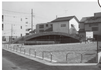
— 白糸台掩体壕 —

戦時中(太平洋戦争末期)に、空襲から戦闘機を守り、隠しておくための格納施設として造られました。いわば、飛行機の防空壕です。