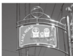
— タマロード商店会 — 京王線多磨霊園駅前の南北に位置する商店街です。