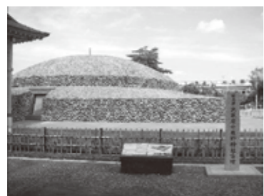
— 武蔵府中熊野神社古墳 —

この古墳は、日本国内でも3例しかない上円下方墳(じょうえんかほうふん)という貴重なものであると確認されました。他の2例(奈良県、静岡県)が7世紀半から8世紀前半とされるのに対し、ここは7世紀前半と判明し、上円下方墳の国内最大で、最古級の古墳とわかりました。2005年7月に国指定の文化財(史跡)に指定されています。