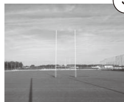
— 府中朝日フットボールパーク —

ラグビーワールドカップ2019ではイングランド・フランス・南アフリカ代表、東京2020オリンピックでは7人制日本代表のキャンプ地になりました。2019年に日本オリンピック委員会より、「JOC認定競技別強化センター」に認定され、国内に3か所ある「ラグビーの認定施設の1つとして、選手強化などの取組が図られています。