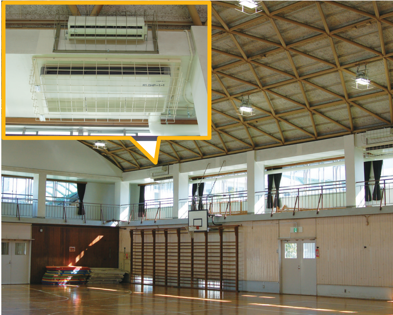
▲小学校全22校の体育館に空調設備が設置されました