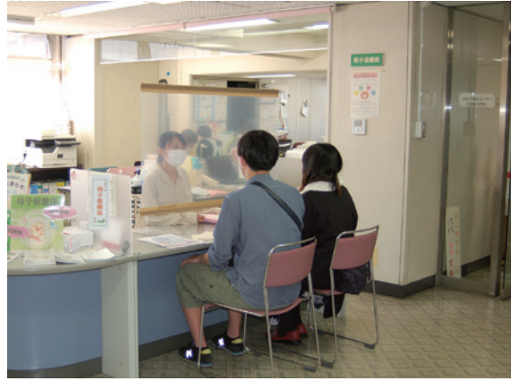
▲母子健康手帳交付窓口(保健センター)

イルス感染症の対策を行いながら、利用したい方が利用できるようにすることや緊急で利用したいという方に対して、待たせることなく利用できるようにすること、令和元年12月に産後ケアが母子保健法に位置付けられたことで、対象期間が産後4か月から1年まで拡大したことに対応できるようにしていくことがありと考えている。