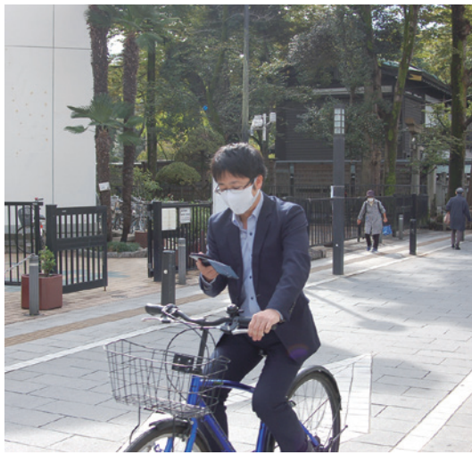
▲「ながらスマホ」はやめましょう (写真はイメージです)

生活環境部長 今後、更に交通事故件数が増加傾向にある場合などには、検討を進めていく必要があると考えている。