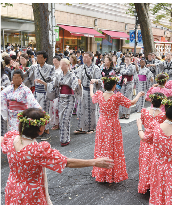
▲市制施行65周年の府中小唄民謡流し

交通企画担当主幹 課題については、鉄道に関するものとして、武蔵野台駅と白糸台駅などの駅の接続性の向上や市内の全ての鉄道駅におけるホームドアの設置の推進が挙げられる。また、バスに関するものとしては、路線バスとコミュニティバスの役割分担に係る検討やコミュニティバスの収支率の改善、利用者のニーズに対応した利便性の向上といったものが挙げられると考えている。