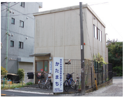
▲地域包括支援センターかたまち

【市長】 特徴としては、介護従事者と在宅医療を担う医療関係者との顔の見える関係づくりや、地域包括支援センターを中心とした医療・介護・福