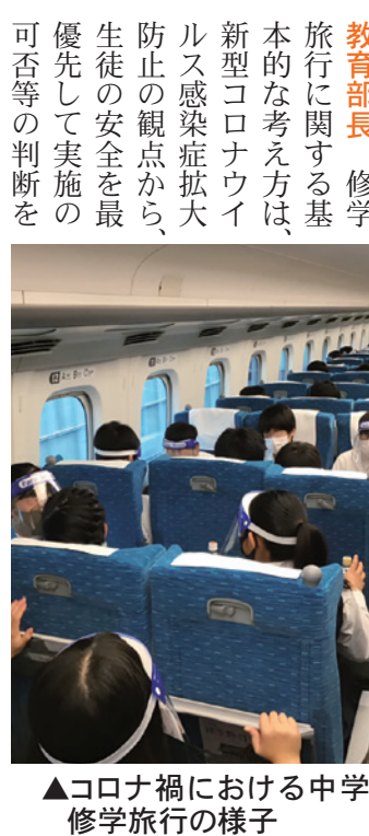
▲コロナ禍における中学校の修学旅行の様子

一括質問 都の不燃化特区内での支援制度 同様の制度を市で実施する考えはあるか 財政面での大幅な負担や人的な負担などが課題が多岐にわたるものと認識している