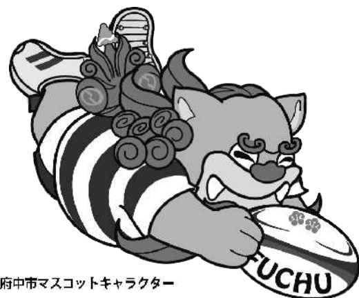
府中市マスコットキャラクター