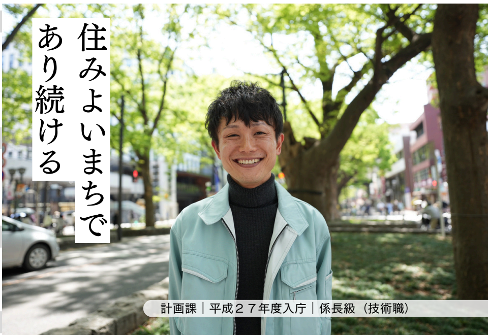
計画課 | 平成27年度入庁 | 係長級 (技術職)