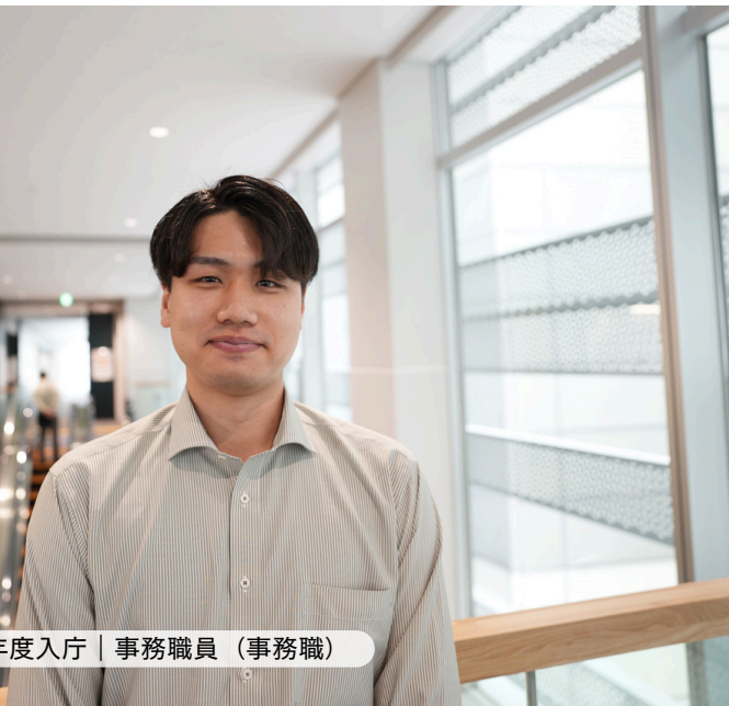
生活福祉課 | 令和3年度入庁 | 事務職員（事務職）