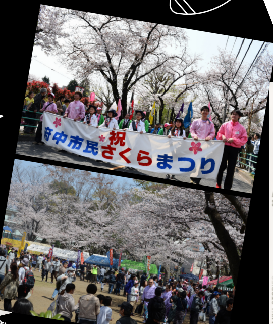
府中市民さくらまつり