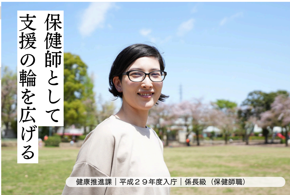
健康推進課 | 平成29年度入庁 | 係長級（保健師職）