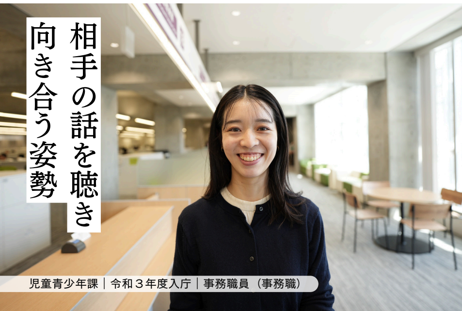
児童青少年課 | 令和3年度入庁 | 事務職員 (事務職)