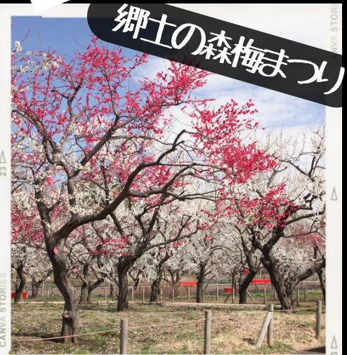
郷土の森梅まつり