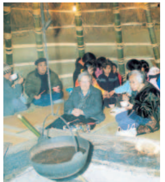
▲どんと小屋で地域のふれあいを

押し立てのどんと焼きの集い ▽日時・内容 ○1月4日(土)午前9時 ：竹切り ○5日(日)午前8時：設営 ○8日(水)午後2時：新春の集い ○11日(土)午後7時：ふれあいの集い ▽問合せ 押し立て文化センター(0424・88・4966) ※白糸台・四谷文化センターでも実施します。詳しい内容は、7ページの「文化センターの催し」をご覧ください。