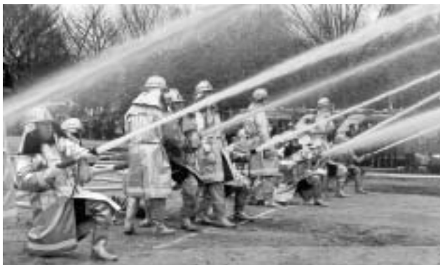
消防団による一斉放水