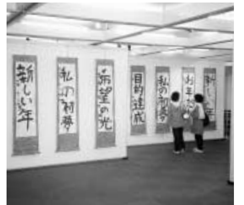
▲昨年の展覧会より

1月6日(月)から10日(金)午前10時～午後5時/小・中学生の部…展示ホール、一般の部…分館ギャラリー/無料