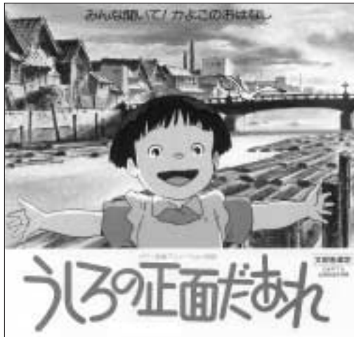
▲海老名香葉子氏原作のアニメーション映画