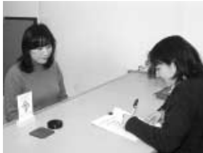
▲思いやりの心を大切に

誤解や不利益などを被っています。 このようなことから、市では、中途失聴者や難聴者の方が安心して気軽に意思の伝達ができる環境を作るため、下の図のとおり耳マークの付いた表示板を窓口カウンターに設置し、筆談などの対応により、きめ細かいサービスを提供します。