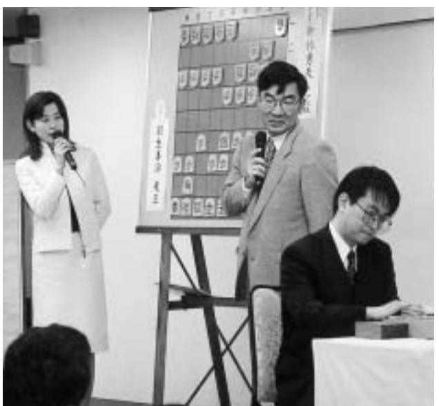
▲堀口六段(中央)と一緒に羽生竜王(右)の対局を解説

本市も、現在進めている府中駅南口の再開発施設に、子育て支援の中核施設の設置を予定しているほか、今後も子育て家庭を応援する事業を進めながら、お二人のように才能豊かで個性あふれる子供たちが、府中から育つ環境作りを進めていきたいと思っています。