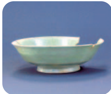
▲府中駅南口第三地区の発掘調査で出土した緑釉陶器碗

▽期間 1月12日(日)から3月2日(日)午前9時~午後5時(入場は4時まで) ▽会場 郷土の森博物館本館ミニ展コーナー・ギャラリー ▽費用 無料(ただし、博物館観覧料大人100円、子供50円が必要)