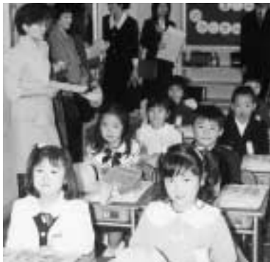
◀手続きは忘れずに

新しく小・中学生になる方へ、1月31日(金)までに、就学通知書を送ります。届いた通知書の返信用はがきに必要な事項を記入して、2月14日(金)までに、必ず返信してください。 なお、国・私立の小・中学校に入学する方は、入学先の入学許可証と印鑑を持って市役所8階総務課へ届け出てください。 また、病気などで入学できない方、期日までに通知書が届かない方は、市役所8階総務課へご連絡ください。 問合せは、総務課学事係(335・4428)へ。