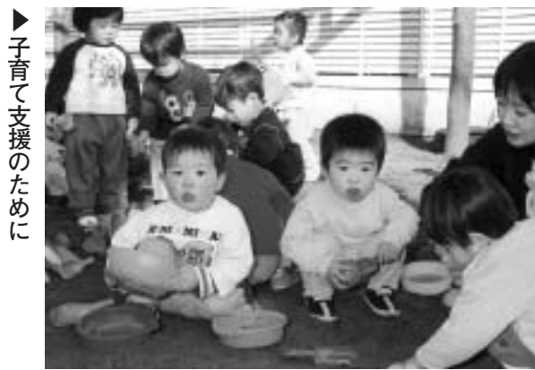
▶子育て支援のために

■利用会員(サービスが必要の方) ▽対象 市民で、おおむね60歳以上の方、または障害のある方 ▽利用料 1時間700円から(家庭支援サービスは30分350円から)／ただし月会費1世帯1000円(介護が必要な方は1人1000円)が必要 ▽別に必要な内容 生活援助・介護支援・家庭支援・食事サービス ■協力会員(サービスを提供する方) ▽対象 社会福祉及び公社事業に理解があり、自分のできる範囲で手助けできる方／申込み後、研修を受講 ▽活動費 1時間700円 ※市民で生活援助サービスを提供した方には、活動した分の時間を貯蓄して、将来、無料でサービスを受けることもできます。 ■賛助会員 ▽対象 市民福祉公社の趣旨に賛同し、金品を援助してくださる方 ◇ 申込み・問合せは、市民福祉公社(334・3040)へ。