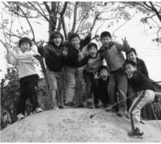
▶21世紀を担う子供たちのために

「参加」から「参画」により、学校、家庭、地域が、それぞれの役割を果たし、子供たちを中心とした輪