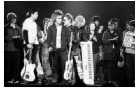
▲予選を勝ち残った実力派ぞろいです

由)/内容はアマチュアバンド20組によるコンテスト/審査員はヤマハ音楽振興会ディレクターほか/チケットは1月11日(土)午前10時からチケットふちゅう(333・9999)、チケットぴあ(0570・02・9999)で電話予約開始