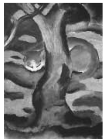
▲フランツ・マルク「木の下の猫」(1910年制作)/70.0×50.0cm/油彩・キャンバス/シュプレングル美術館蔵

2月8日(土)・23日(日)午後2時 企画展示室入口集合/無料(ただし、企画展観覧料が必要)/説明は当館学芸員