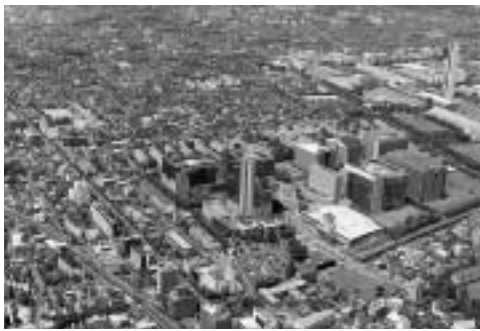
住みよいまちづくりを指して

▽用途地域などの指定に係る指定方針 低層住宅、中高層住宅、商業・業務、沿道商業・業務、産業・住居、産業、大規模土地利用の7つの地域ごとに策定