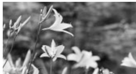
▲黄色く鮮やかに咲くムサシノキスゲ

日(土)・16日(日)午前10時~午後4時/雨天中止 ▽会場 浅間山山頂あずま屋 ▽内容 ムサシノキスゲ、キンラン、ギンランなどの紹介、浅間山に咲く花や野鳥などを写真パネルで展示ほか ※5月16日(日)まで、生涯学習センターで写真展「浅間山の花たち」も開催します。 ▽主催 武蔵野公園事務所、浅間山自然保護会、府中野鳥クラブ ■浅間山自然観察会 ▽日時 5月16日(日)午前10時/雨