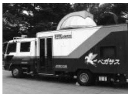
▲移動天文観測車ベガサス