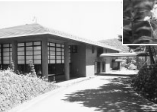
▲ヒヨドリソウやギボシなど高原の草花が楽しめます

▽利用期間 8月10日(火)から20日(金) ▽対象 市内に住居票、または外国人登録原票のある方 ▽申込み 5月13日(木)まで(必着)に、決められた往復はがき(5月6日(木)から12日(水)に、市役所1階総合窓口課、府中グリーンプラザ、ルミエール府中、各文化館で配布)で、住宅勤務課へ/5月20日(木)午前10時に、市役所北庁舎3階会議室で公開抽せん ※抽せん後に空き室が出た場合は、6月8日(火)から先着順に受け付けます。 ▽問合せ 住宅勤務課労働福祉係(335・4125)