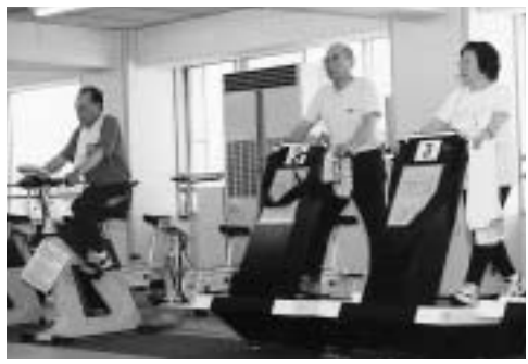
適切な運動で健康増進

生活習慣病は、運動不足や栄養の過剰摂取、喫煙、飲酒、ストレスなどの日常生活の積み重ねが原因と考えられます。