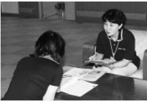
お気軽にご相談を

高齢者見守りネットワークは、一人暮らしの高齢者の方や高齢者のみの世帯の方など、地域とのつながりが薄