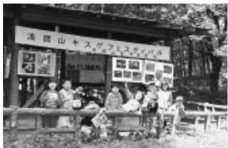
▲美しい花々と心地よい風に笑顔があふれます

日(土)・16日(日)午前10時~午後4時/雨天中止 ▽会場 浅間山山頂あずま屋 ▽内容 ムサシノキスゲ、キンラン、ギンランなどの紹介、浅間山に咲く花や野鳥などを写真パネルで展示ほか ※5月16日(日)まで、生涯学習センターで写真展「浅間山の花たち」も開催します。 ▽主催 武蔵野公園事務所、浅間山自然保護会、府中野鳥クラブ ■浅間山自然観察会 ▽日時 5月16日(日)午前10時/雨