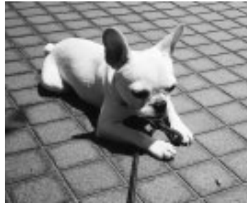
▲大切な愛犬のために

※犬の登録をされている方は、飼い犬に生涯1回の犬の登録と毎年1回の狂犬病予防注射が義務づけられています。犬の登録と狂犬病予防注射を次のとおり行います。問合せは、市民医療センター管理係(368・5311)へ。 ▽実施日・時間・会場 左の表のとおり ▽費用 登録料3000円、狂犬病予防注射料3000円、注射済票550円 ※当日は、釣り銭がないようお願いします。 ※3月2日以降に狂犬病予防注射を済ませている方は、注射済票を持って、当日会場で、または市民医療センター、市役所1階総合窓口課、白糸台・西府文化センターで注射済票の交付を受けてください。