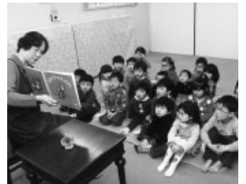
▲楽しいおはなしが待っています

■中央図書館「おはなしの森」 ▽日時 5月6日・13日・20日・27日(木)午後3時半(3歳以上)・4時(小学生) ■押立図書館 ▽日時 5月12日(水)午後3時半 ■四谷図書館 ▽日時 5月19日(水)午後3時半 ■生涯学習センター図書館 ▽日時 5月26日(水)午後3時半 ◇ ◇ ◇ ▽入場 自由(無料) ▽内容 絵本や昔話などの読み聞かせ ▽問合せ 中央図書館(362・8647)、押立図書館(0424・83・4122)、四谷図書館(360・3663)、生涯学習センター図書館(336・5702)