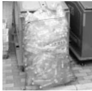
▲正しい出し方にご協力