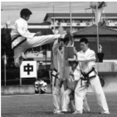
▲昨年の開会式後に行われたテコンドーの模範演技

▽申込み 8月20日(金)正午までに、市役所8階体育課へ / 乗馬は8月2日(月)、軟式野球は8月9日(月)正午まで