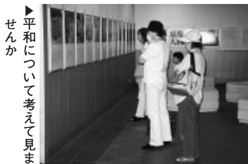
▶平和について考えて見ませんか