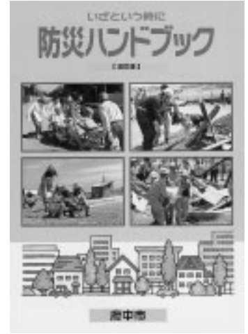
▲いざというときのために