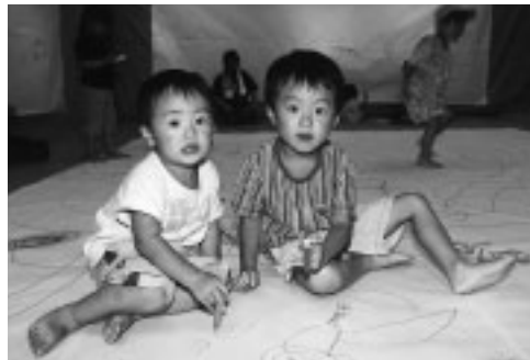
子供の健康のために

乳幼児医療証は、毎年10月1日に更新します。有効期間が平成17年9月30日までの医療証をお持ちの保護者の方に、現況届を郵送しました。現況届は、乳幼児医療費助成の受給資格を審査するために必要です。内容を確認のうえ、記入押印して、期間内に提出してください。また、送られた現況届に記載されている乳幼児以外に、対象となる年齢の乳幼児がいる場合は、現況届に追加記入してください。