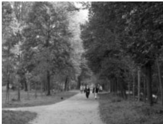
▲散歩中に野生動物に出会うことも

10月下旬に初雪が降りました。本格的な冬の訪れとともに、雪をまとい幻想的な表情を見せるシユバルツェンベルグ公園には、そり滑りやクロスカントリースキー、スケートなどウィンタースポーツを楽しむ人々にぎわうことでしょう。