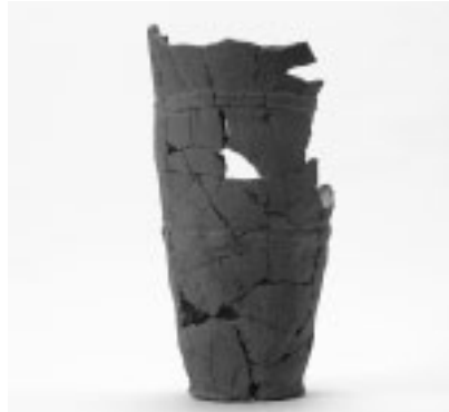
▲御嶽塚古墳群で出土した円筒埴輪

なお、御嶽塚古墳群については、「新版府中市の歴史」にも収録していますのでご覧ください。