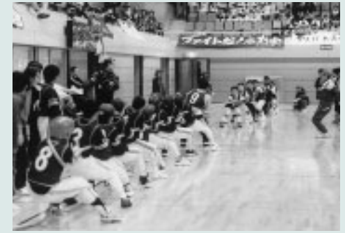
▲みんなの力を合わせて