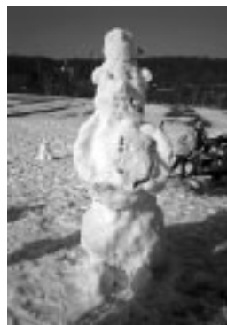
▲どこかおしゃれな雪だるま

い思いに公園での休日を楽しんでいます。 また、散歩道がきれいに整備されていることから、ベビーカーで散歩を楽しんでいる親子も多く見かけます。 子供たちにとってもこの公園は大変魅力的なところで、木登りやぶらんこ、雨上がりにはカタツムリなどを探したり、風が強い日には、子供たちが手作りのカラフルなたこを持ち寄り、競うようにたこ揚げを楽しんでいます。