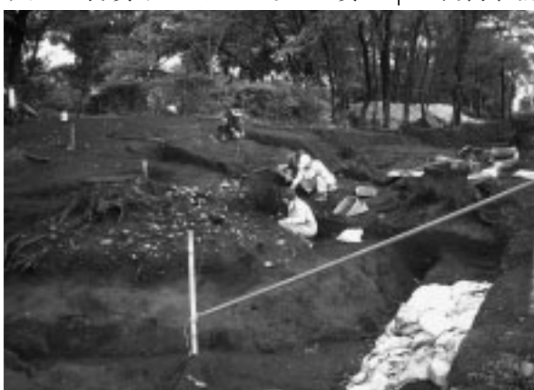
▲御嶽塚の発掘調査

西府文化センター付近の段丘崖(ハケ)上には、古墳時代後期(6~7世紀中ごろ)に築造された直径約10メートルの小さな円墳群が存在し、これを「御嶽塚古墳群」と呼んでいます。この古墳群は、地上にあった墳丘