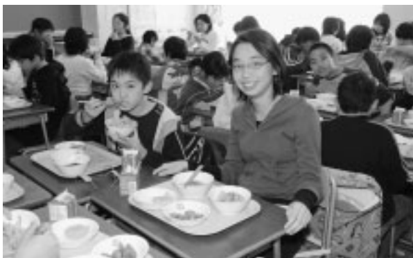
▲学校給食を通して食の大切さを伝えます