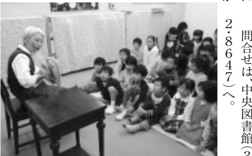
▲ボランティアによる読み聞かせ

学校や地域で、子供たちに絵本の読み聞かせをする方が増えています。そこで、図書館では今まで閲覧のみでご利用いただいていた「読み聞かせ」向け絵本のリストを新たに作成し、中央・各地区図書館で希望する方に配布しています。このリストには対象年齢や読み聞かせにかかる時間、テーマなどを記載しています。ぜひ、ご利用ください。