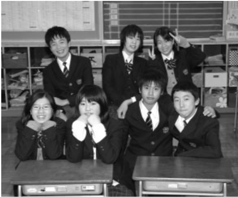
▲仲間とともに笑顔あふれる学校生活を