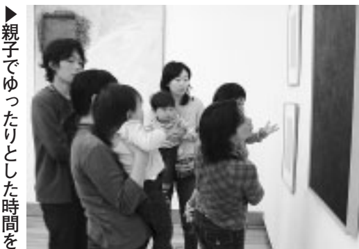
▶親子でゆったりとした時間を

供と一緒に美術を鑑賞することで、リラクセス、リフレッシュし、また親同士が交流できる機会を提供しています。11月に実施した「はじめアート」では、1歳児とその親が保育士によるゲームや親子遊びの後、学芸員の案内で常設展示室や牛島憲之記念館めぐり、普段と違った空間で交流を行いました。今回の申込みは、受付開始後わずか10分で定員となつてしまふほど人気が高くなり、締め切った後も「次回はいっ行くのでしょか」という声が多く聞かれました。昨年度から試験的に始めた事業ですが、今後は、開催を定着させていきたいと