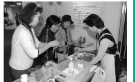
▲食品の安全性などについて考えましょう