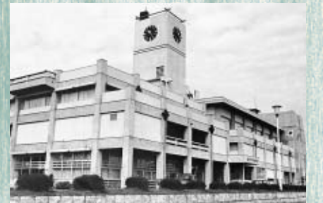
(写真上)開館当時の市民会館、(写真下)市民会館・中央図書館複合施設として開館するルミエール府中

老朽化などに伴い平成17年3月に閉館したルミエール府中は、12月1日(土)に、市民会館・中央図書館複合施設として、新たに生まれ変わります。