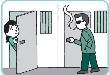
見慣れない人が出入りしているけれど大丈夫?