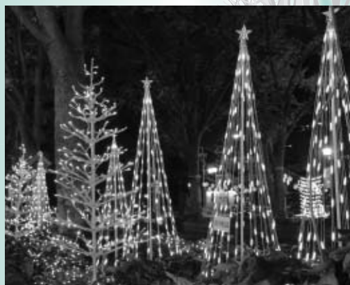
▲冬のけやき並木を彩るイルミネーション

地元商店街、企業・団体、東京競馬場などの協力で、冬のけやき並木と光輝く世界をつくり出します。 期間 12月25日(火)まで 日没~午後10時 場所 けやき並木とその周辺 問合せ けやき並木イルミネーション実行委員会事務局(335・4095=経済観光課内)