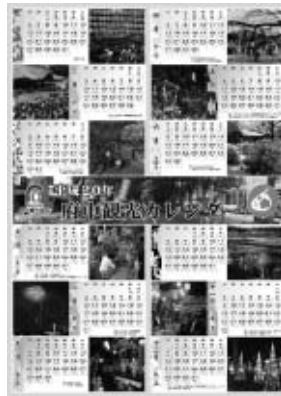
季節ごとの行事や風景とともに

府中観光協会では、平成20年の観光カレンダーを販売しています。 ▽販売場所 市役所4階経済観光課、観光情報誌、市政情報誌 ▽価格 300円(B2判ポスタータイプ) ▽問合せ 経済観光課観光係(335・4095)、または観光情報誌(302・2000)