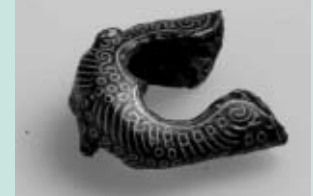
「鞘尻金具」飛鳥時代