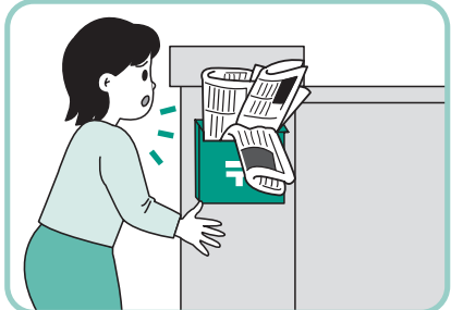
新聞がたまったままで心配