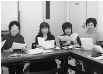
▲朗読を通して互いに学び合い、心や人生を豊かにできるように