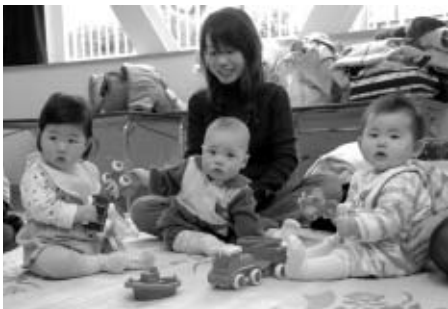
▲子育てを支援します