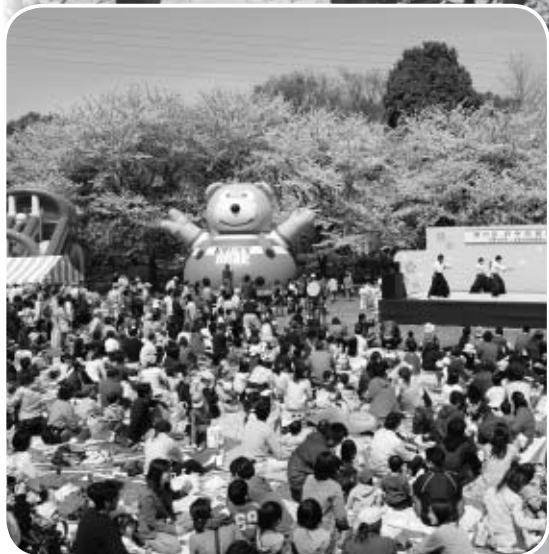
▲会場は楽しい催しでいっぱいです