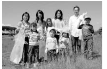
▲みんなできれいな多摩川を