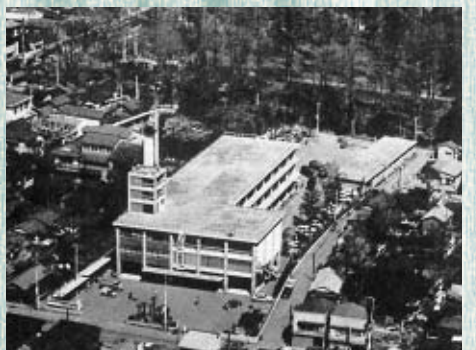
(写真上)昭和35年新設当時の市役所本庁舎、(写真下)現在の市役所本庁舎

現在の本庁舎は昭和34年末に完成し、昭和35年1月から執務を開始しました。移設にあたっては、府中公園予定地、甲州街道と小金井街道の交差点北東側も候補としてあがりましたが、市の中心部にあり交通の便が良いことなどから現在の場所に決定しました。人口の増加とそれに伴う行政需要の増大で手狭になったため、昭和45年に東庁舎の5階までを、昭和54年に8階までを増築しまし