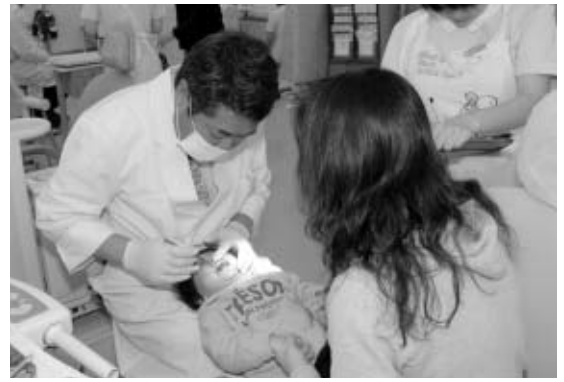
正しい歯磨きで健康な歯を