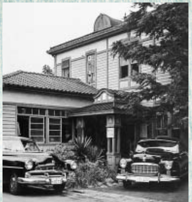
(写真上)昭和31年当時の市役所本庁舎、(写真右)郷土の森博物館に復元された旧府中町役場

の市制施行後も市役所本庁舎として使用され、昭和35年に本庁舎が現在の場所に移設された後も市立図書館、教育研究所などとして利用されました。昭和59年に老朽化により解体されますが、昭和61年に郷土の森博物館内にしゅん工当時の姿に復元されました。復元に伴い実施された調査で、本館は屋根に飾り天窓を備えた洋風でありながら、玄関上部に