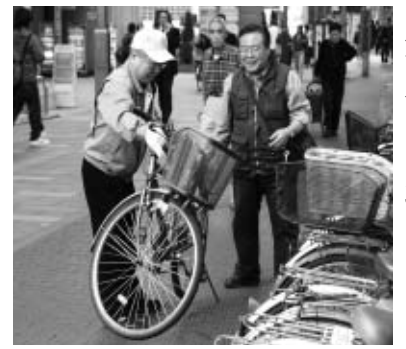
◀触れ合いを大切に