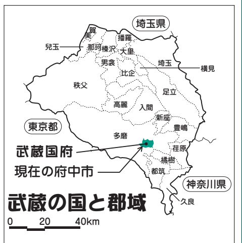
▲現在の1都2県にまたがる武蔵国の中心であった府中

の行政事務を行った役所群である国衙の中心建物跡が発見された場所を市の史跡に指定し、保存・整備を行いました。宮町2の5で、復元整備が完成した1300年前の国衙の姿がご覧いただけます。ぜひ、ご来場ください。