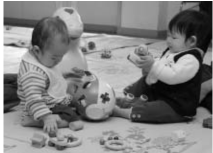
▲友達の輪が広がります