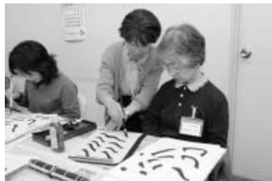
▲豊かな経験を生かした書道教室