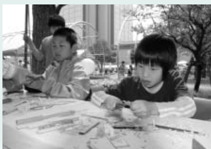
▶手作りの楽しさを体験しよう