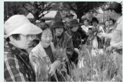
◀色彩豊かな草花が並びます