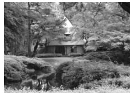
▲色鮮やかな木々をお楽しみください