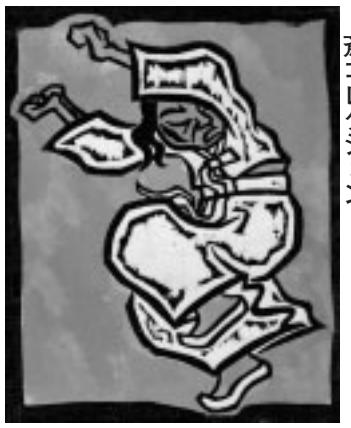
▲吳潤「踊りⅡ」(1985年)、青冠 齋コレクション

7月20日(日)午後2時 講座室 /先着60人/無料/講師は高 晟 峻氏(新潟県立万代島美術館主任学 芸員)