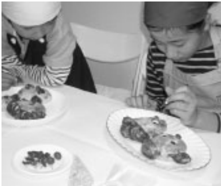
▲おいしく作れるかな

8月9日(土)・10日(日)午前10時半~午後1時 料理講習室/対象は小学生の市民と保護者/定員各日10組20人(抽せん)/費用3000円/内容はパンで作るパパ・ママの顔、チキンのカリカリ焼き、ピザ/講師は吉永順子氏(料理研究家)/申込みは7月2日(水)から15日(火)に、電話、またはFAX(361・4398)に参加希望日、住所、氏名(ふりがな)、学年、電話番号、保護者氏名、兄弟・姉妹の見学の有無・人数を記入して、市民会館へ/問合せは同館へ