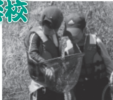
▲多摩川の自然に触れてみよう