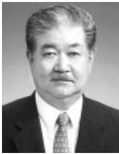
宮西町5の4/70歳/前副市長

任期満了に伴う府中市副市長の人事は、6月の市議会定例会で議会の同意を得て、中島信一氏が選任され、6月26日に就任しました。任期は4年です。