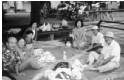
▲草履作りを通して物の大切さを学びます