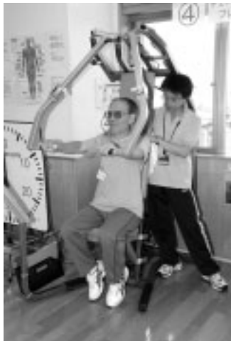
器具を使用した体力測定

■認知症予防教室「遊友クラブ」説明会 ①9月4日(木)・19日(金)・②25日(木)午後1時半～3時／対象は65歳以上で介護保険サービスを利用していない市民／各日先着50人／無料／内容は①旅行・②園芸の計画・実施などを通して行う認知症予防教室の説明ほか／申込みは当館へ