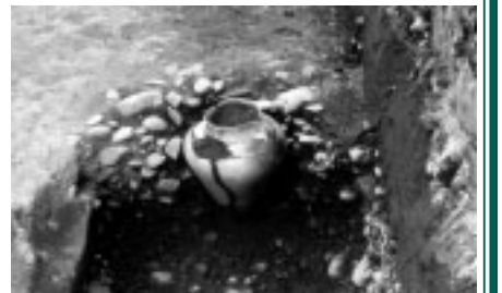
▲発掘された再埋葬

レース時には数万人の歓声が響く東京競馬場は、弥生時代の遺跡と戦国時代の遠い風景が合わさる歴史のボールに包まれた地域なのです。