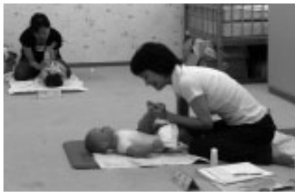
▲親子のスキンシップの1つとして

11月19日・26日(水)、12月2日(火)・10日(水)午後1時10分~2時10分・2時40分~3時40分(各全4回) 託児室/対象は6か月以下の乳児と母親/定員各8組/費用3200円(保険料、オイル代含む)/内容はオイルを使ったベビーマッサージ/講師は佐川久美子氏(国際インファントマッサージ協会公認インストラクター)/申込みは10月16日(木)まで(必着)に、往復はがき(1組1枚)に希望時間、住所、氏名、電話番号、乳児の氏名・月齢、返信用あて名を記入して、当館「ベビーマッサージ教室」係へ/申込み多数の場合は初めての方を優先して抽せん