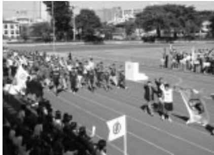
▲参加者による入場行進