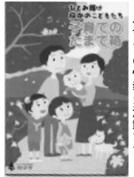
子育ての情報が満載です

▽配布日 9月25日(木)から ▽配布場所 市役所6階子育て支援課、子ども家庭支援センター「たち」 ▽内容 主に妊娠時から小学校就学前の子どもを対象とした、市の事業や子育てについての様々な情報を掲載 ▽問合せ 子育て支援課推進係(335・4192)