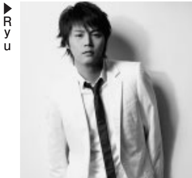
府中の森芸術劇場10月の休館日 6日・20日・27日(月)

11月14日(金)午後7時 どりーむホール/入場料6300円(全席指定)/出演はRyu(歌)、ウィンターソナタバンド/曲目は「最初から今まで」「My Memory」「あなただけが」ほか/「冬のソナタ」の映像付き/チケット予約開始は9月27日(土)/発売は翌日から/小学校入学前のお子さんの入場不可