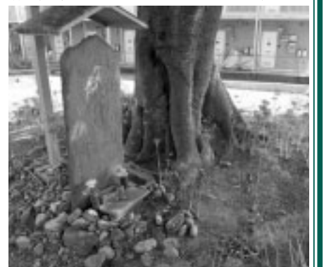
▲三千人塚と康元元年銘の板碑

として礫石経が積み足されたものであったことが明らかになりました。長い歴史の中で形や性格を変えながらも、地元の人の手によって大切に守り伝えられてきた三千人塚を、これからも貴重な文化財として保存、継承していくことが大切です。