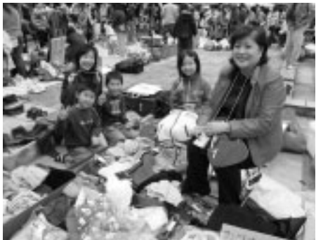
▲あなたも出店してみませんか