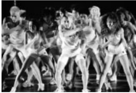
▲マッスルミュージカル

11月7日(金)午後6時半 どりーむホール/入場料7500円(前売りは500円引き、全席指定)/チケット予約開始は9月23日(祝)/発売は翌日から/小学校入学前のお子さんはひざ上での鑑賞可