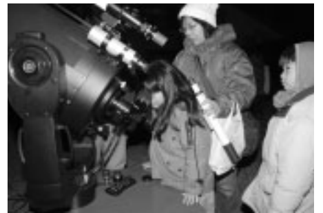
▲高性能の望遠鏡で夜空を観察

(土)まで(当日消印有効)に、往復はがきに参加希望人数(6人まで)、住所、氏名、年齢、電話番号、返信用あて名を記入して、当館へ