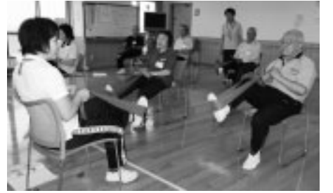
▲介護予防運動で元気な体を

10月1日(水)午後1時半~3時/対象は65歳以上で介護保険サービスを利用していない市民/先着10人/内容は介護予防教室の体操などの紹介/申込みは電話で当館へ