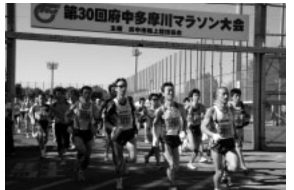
▲自己ベストを目指して

(金)まで(必着)に、決められた用紙(市役所8階生涯学習スポーツ課、市民陸上競技場に用意)に費用を添えて、府中多摩川マラソンエントリー(〒104-0032中央区八丁堀1の8の6 ASAHIYAビル5階)へ