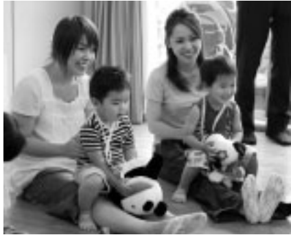
▲みんなで楽しく遊ぼう