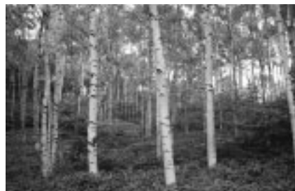
▲黄金色に色づくシラカバ林

佐久穂町の秋は、紅葉の名所として知られる白駒池周辺からはじまります。コメツガやシラビソなどの原生林に囲まれたこけむした道を抜けると、湖畔には池を囲むようにドウダンツツジが赤く色づいています。