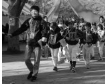
▲子どもたちと市内を歩きます