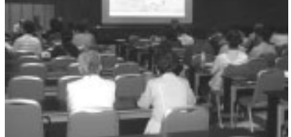
▲幻燈会の会場風景