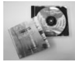
▲八千穂高原イメージ曲「白い森の伝説」

なお、「白い森の伝説」のCDは、1050円で販売しています。購入をご希望の方は、佐久穂町産業振興課観光係(0267・88・3956)へ。