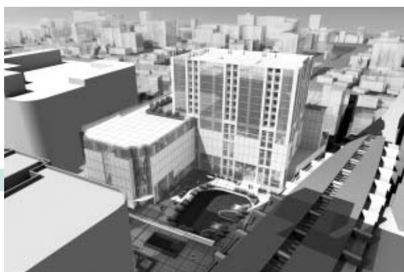
▲第一地区完成予想図