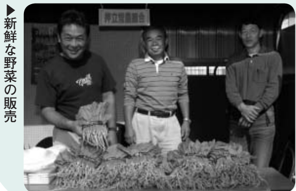
▶新鮮な野菜の販売