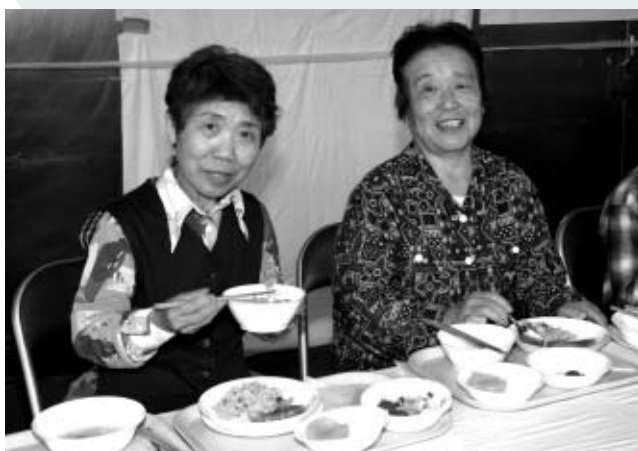
▲普段味わえない給食を食べてみませんか