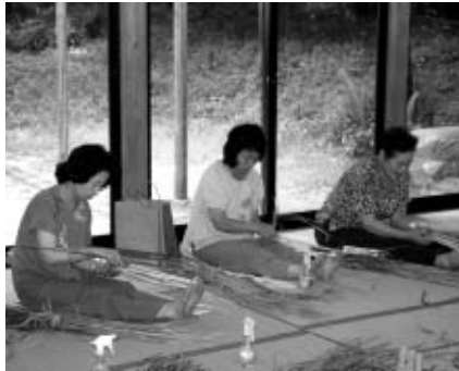
▲手足を使ったわらぞうり作り