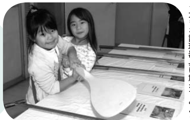
▲大きな調理器具に触れてみよう