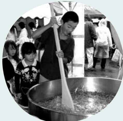
▲巨大がまを使った調理体験