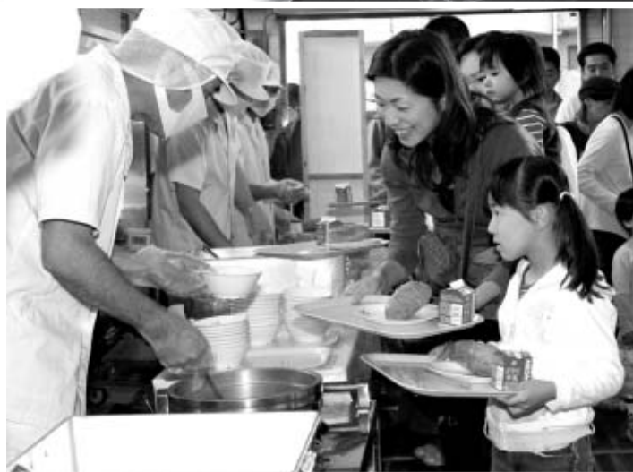
▲安全でおいしい給食を提供します

▽日時 10月25日(土)午前10時~午後3時 ▽会場 第一学校給食センター ※車の来場はご遠慮ください。