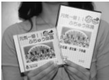
▲ふちゅう体操で元気な体を

市では、市民の皆さんが楽しんで健康づくりや介護予防に取組めるように、「元気一番!!ふちゅう体操」を収録したDVD・CDを貸し出します。 ▽貸出場所 介護予防推進課、各在宅介護支援センター、地域包括支援センター、中央・生涯学習センター図書館 ▽費用 無料 ▽問合せ 高齢者支援課予防マネジメント担当(335・4117)