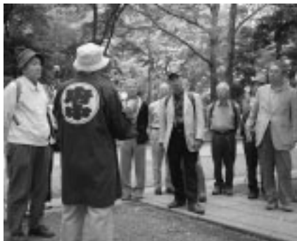
▲府中の魅力を伝えてみませんか