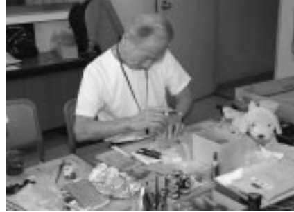
▲心を込めて直します

後1時 ▽会場 府中グリーンプラザ分館 ▽対象 市民 ▽費用 無料(部品代有料) ▽内容 壊れたおもちゃの修理/1世帯2点まで ※付属品や説明書を持参してください。 ▽問合せ リサちゃんショップけやき(360・3751)