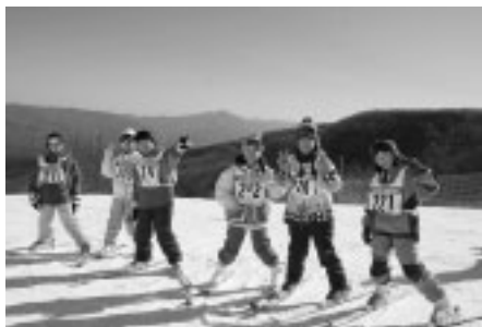
楽しくスキーを学ぼう

スポーツ部生涯学習スポーツ課「ジュニアスキー」係へ ▽問合せ 生涯学習スポーツ課スポーツ振興係(335・4499)