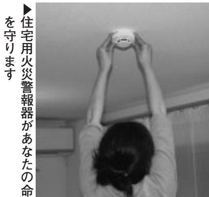
住宅用火災警報器があなたの命を守ります