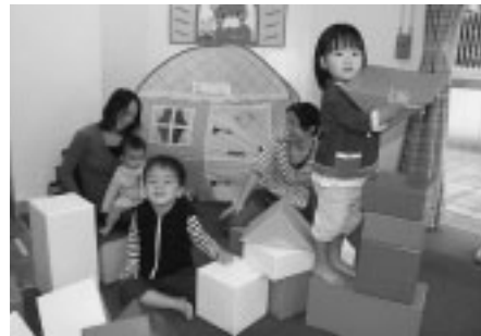
▲みんなで楽しく遊ぼう

市では、宝くじの助成を受けて、幼児用ソフト積み木11組と卓球台14台を文化センターに設置しました。 問合せは、市民活動支援課地域コミュニティ係(335・4137)へ。