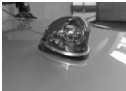
▲犯罪抑止に効果的な青色回転灯

▽申込み 平成21年2月2日(月)までに、市役所2階資産税課へ ※すでに非課税の私道は、申込みの必要はありません。