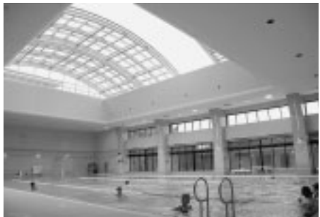
▲ぜひ、ご利用ください

■水泳ワンポイントレッスン 11月26日(水)午後7時～8時・27日(木)午後3時～4時・28日(金)午前11時～正午/各日先着10人/使用料2時間400円/申込みは当日プールスタッフへ/問合せは体育受付へ ■温水プールの高齢者専用コース 11月5日(水)・25日(火)午前9時～午後1時/対象はおおむね60歳以上で25分以上泳げる方/使用料2時間400円/指導員は付きません/問合せは体育受付へ