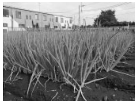
▲府中産の新鮮なネギを