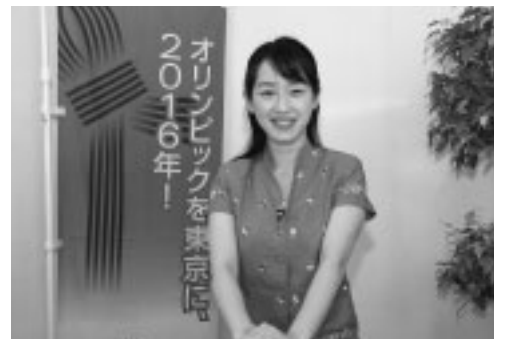
▲身近な情報を伝えます

▽日時 毎日の午前11時、午後3時・8時(15分番組) ▽番組 J:comチャンネル(アナログ放送は2チャンネル、地上デジタル放送は11チャンネル) ▽内容 市の施策、各種制度の紹介、催し物情報ほか ※内容は毎月1日・11日・21日に更新します。 ※一部手話通訳があります。