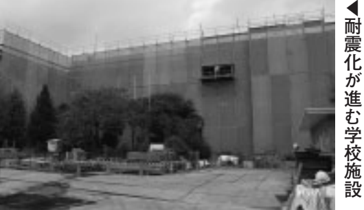
▲耐震化が進む学校施設