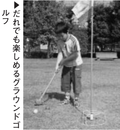
ルフ ▶だれでも楽しめるグラウンドゴルフ

▽日時 11月16日(日)午前8時半~正午/雨天の場合は12月7日(日) ▽会場 府中公園 ▽対象 小学4年生以上の市民 ▽費用 500円(保険料含む) ▽申込み 11月10日(月)までに、決められた用紙(市役所8階生涯学習スポーツ課に用意)で、生涯学習スポーツ課へ ▽問合せ 生涯学習スポーツ課スポーツ振興係(335・4477)