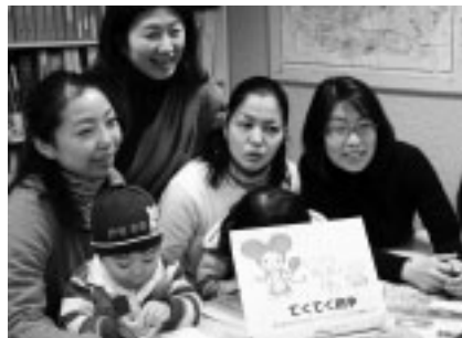
▲生活に役立つ情報を伝えます