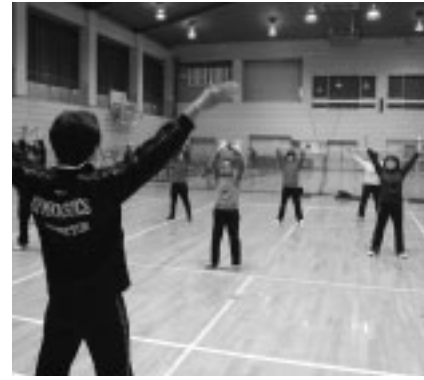
▲体操教室で健康な体に

3月27日(金)午後3時 市役所北庁舎3階会議室/傍聴希望の方は当日直接会場へ/問合せは計画課土地利用担当(335・4412)へ