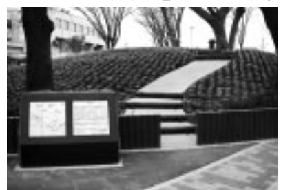
▲整備された御嶽塚

で、直径約25メートルの墳丘と、その周囲に約4メートル幅の溝がめぐる円墳であることがわかりました。西府文化センター周辺では、御嶽塚のほかにも、古墳時代後期の6～7世紀初めごろに築かれた古墳が13基確認されており、これらの古墳は、御嶽塚にちなんで御嶽塚古墳群と呼ばれています。もとは古墳であった御嶽塚が、いつごろなぜ信仰の対象になったかは、いまだなぞに包まれています。