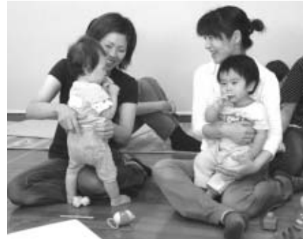
▲親子で楽しく交流を

▽開催日・会場・対象年齢 右上の表のとおり ▽時間 午前10時~11時半/園庭開放は午前9時半~11時(南保育所は