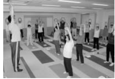
▲楽しく学んで元気に暮らしましょう

8月5日(水)午後1時半~3時 / 対象は65歳以上で介護保険の認定を受けていない市民 / 先着10人 / 内容は介護予防教室の体操などの紹介 / 申込みは電話で当館へ