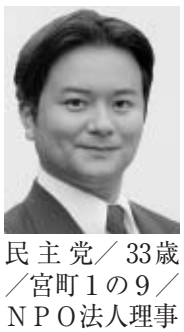
民主党/33歳/宮町1の9/NPO法人理事