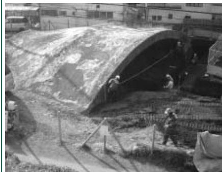
▲平和への思いを未来に伝えます

平和への記念碑として、白糸台掩体壕の保存・整備に、ご理解とご協力をお願いします。