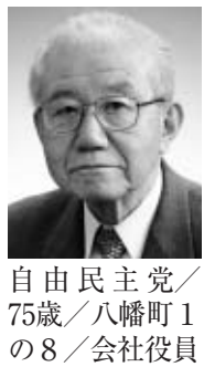
自由民主党/75歳/八幡町1の8/会社役員