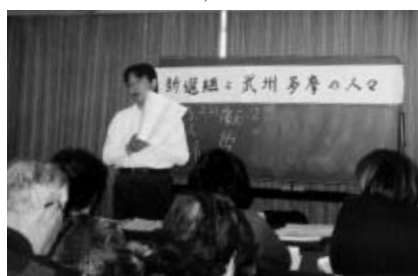
▲地元の歴史を学びます