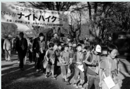
▲元気に楽しく市内を歩こう

※10人以上のグループは決められた用紙(市役所6階児童青少年課に用意)で、児童青少年課へ。▽問合せ 児童青少年課青少年係(335・4427)