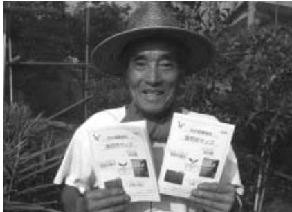
▲安全で新鮮な農産物を提供します

▽配布場所 市役所4階経済観光課・1階市民相談室、各文化館、市政情報館、観光情報館 ▽内容 府中産の新鮮な農産物を販売している市内約60か所の直売所の案内 ※在庫がなくなり次第、配布を終了します。 ▽問合せ 経済観光課農政係(335・4143)