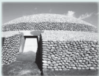
▲国内最大最古の上円下方墳