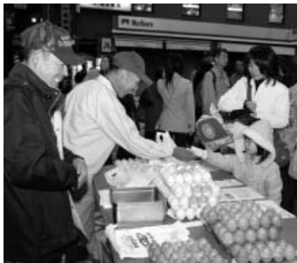
▲早起きして、お越しください