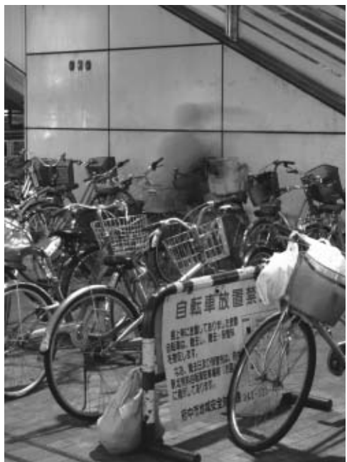
▲迷惑駐車はやめましょう

「私の1台くらいなら」という気持ちで、放置自転車を増加させ、様々な迷惑の原因になります。自転車を利用する一人ひとりがルールとマナーを守り、住みよいまちづくりにご協力ください。