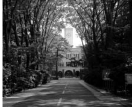
▲緑に囲まれた東京農工大学のキャンパス

▽日時 11月14日(土)午前9時~正午/荒天中止 ▽集合場所 府中グリーンプラザ前 ▽定員 先着50人 ▽費用 無料 ▽内容 緑の活動推進委員の案内で、東京農工大学を巡る約7.6キロの