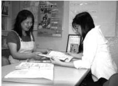
▲サービスの充実に取り組んでいます