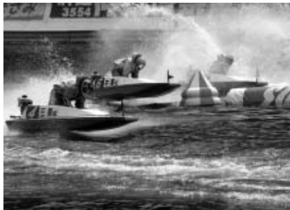
▲迫力あるレースをお楽しみください