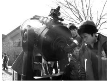
▲空の違いを観測しよう

▽日程 12月12日(土)・13日(日)/1泊2日 ▽集合時間・場所 午前9時に寿町3丁目公共用地 ▽対象 小学4年~中学生の市民 ▽定員 40人(抽せん) ▽費用 小学生3500円、中学生3900円(宿泊費、食事代、体験料) ▽内容 府中と八ヶ岳の空を見比べる ※11月28日(土)午後3時10分から郷土の森博物館で行う事前勉強会と保護者説明会に、必ず出席してください。 ▽申込み 11月4日(水)まで(必着)に、はがきに参加希望者全員の住所、氏名(ふりがな)、年齢、学校名・学年、性別、電話番号を記入して、府中「多摩・島しょ子ども体験塾」事務局「冬の星空観測ツアー」係(〒183-8703子ども家庭部児童青少年課内)へ ▽問合せ 府中「多摩・島しょ子ども体験塾」事務局(335・4427=児童青少年課内)