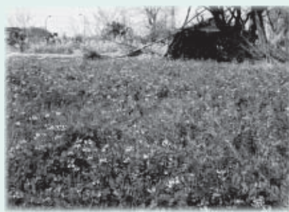
▲多くの自然が残る四谷のふるさと景観