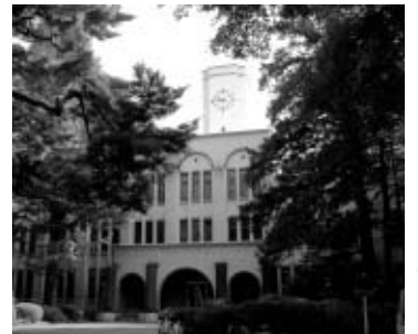
▲歴史を感じさせる東京農工大学農学部本館

「東京文化財ウィーク」にちなみ、11月2日(月)から8日(日)は一般公開されます。市内でも数少ない近代洋風建築の粋を集めた建物を、ぜひ、ご覧ください。