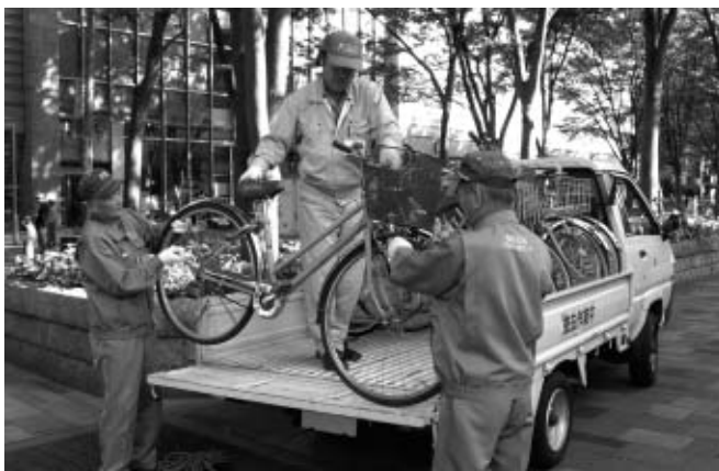
▲放置自転車は撤去します