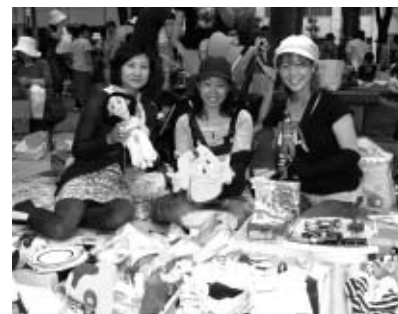
▲掘り出し物が見つかります

▽問合せ リサイクルフェスタ実行委員会事務局(360・3751=リサちゃんショップけやき内)