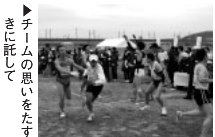
▶チームの思いをたすきに託して

▽チーム編成 1チーム選手5人、補欠2人、監督1人／④⑤は市内の中学校で1校男女5チーム以内 ▽費用 ①～③1チーム3500円、④⑤無料 ▽申込み 12月22日(火)まで(必着)に、決められた用紙(市役所8階生涯学習スポーツ課、市民陸上競技場に用意)と参加費分の定額小為替を、〒183-8703文化スポーツ部生涯学習スポーツ課へ／持参可／用紙は市のホームページ( http://www.city.fuchu.tokyo.jp/ )からもダウンロード可 ▽問合せ 生涯学習スポーツ課スポーツ振興係(335・4499)