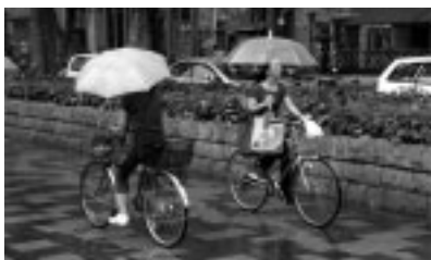
▲安定性を失う片手運転は禁止です

しながらの片手運転は安定性を失い大変危険なのでやめましょう。また、傘を器具でハンドルに取り付けての運転も、視界が狭くなり、歩行者と接触する危険があるのでやめましょう。