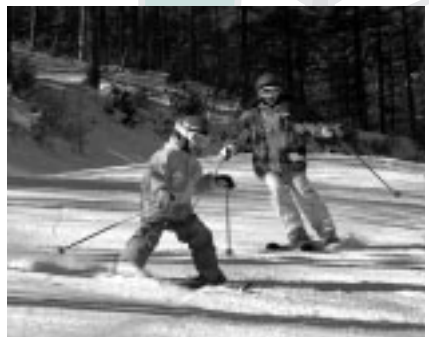
▲冬の思い出をつくりませんか

活動支援課、各文化館などで配布しています。また、佐久穂町観光協会ホームページ( http://yachiho-kogen.jp/ )からもダウンロードできます。