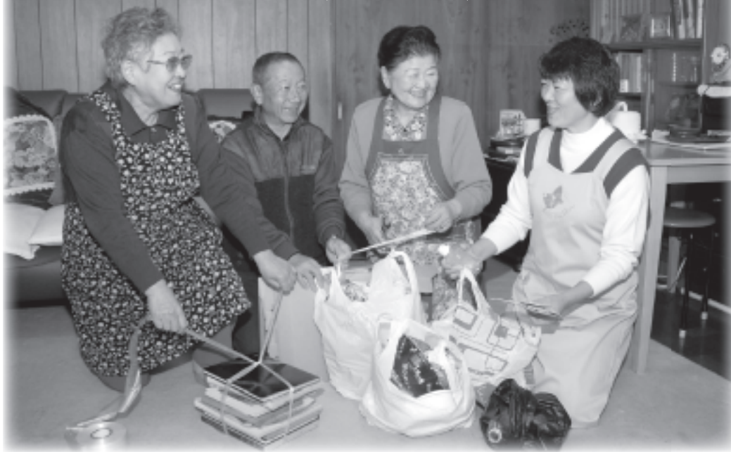
◆年末年始のごみ収集日程◆

収集が休みの間は、各家庭・事業所でごみ・資源を保管してください。また、年始はダストボックスからごみがあふれないよう、小分けにして出してください。問合せは、ごみ減量推進課管理係(335・4400)へ。