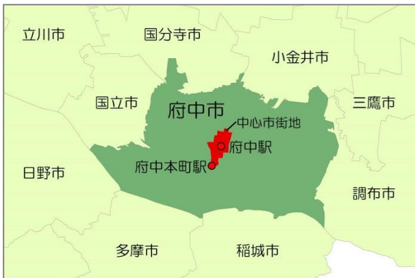
図1 中心市街地の位置図