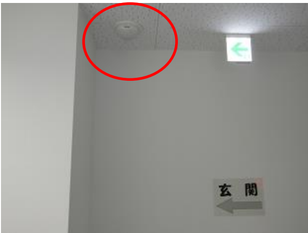
給食センター 2階位置図