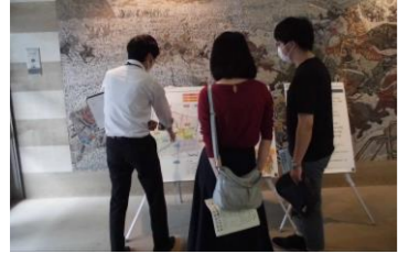
若い世代もご来場いただきました。