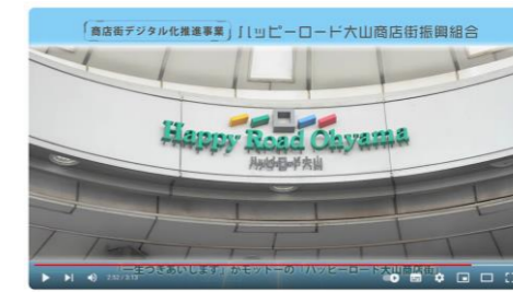
YouTube による発信 （ハッピーロード大山商店街振興組合）