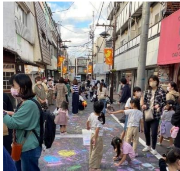
チョークアートの実施（小平市：学園坂商店街）