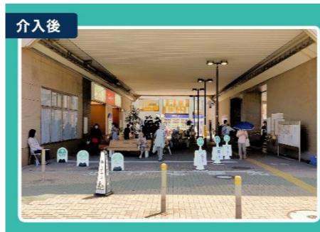
狛江駅周辺の自転車の押し歩き