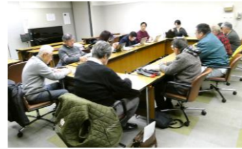
にぎわい検討部会の様子