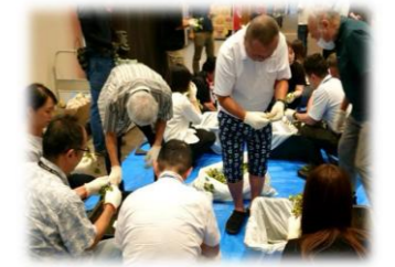
MINANOにおけるホップ収穫の様子

来年度は、取組を共に進める方を探し、にぎわいづくりの取組実施を見据えた体制づくりを進めます。