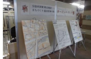
パネル展示の様子