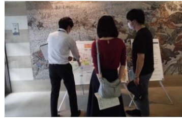
若い世代もご来場いただきました。