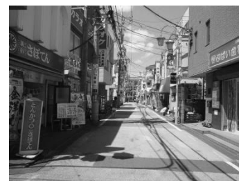
幅員約 5.5mの商店街通り