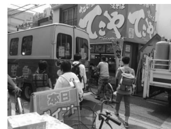
歩行者、自転車、自動車が錯綜している様子