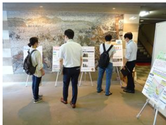
オープンハウスの様子

検討中の まちづくりルール について、パネル展示形式 でご説明します。 自由に入退場 でき職員と意見交換も できますので、下記の間接報告会に参加された方もせ ひ、お立ち寄り下さい。