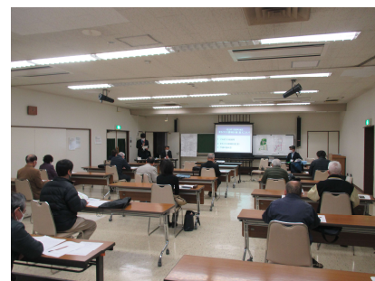
▲ 説明会当日の様子