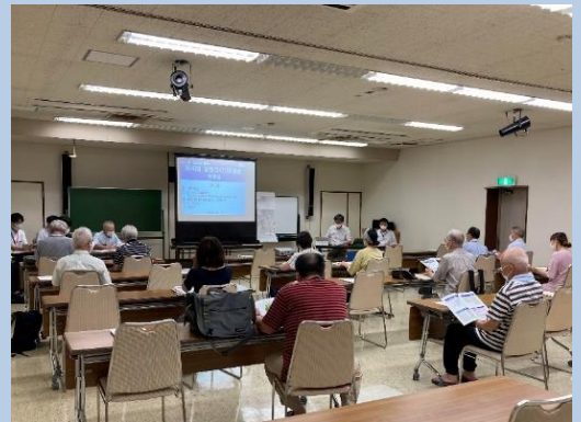
↑ 第4回まちづくり協議会の様子 (令和3年9月4日開催)

まちづくり協議会は傍聴が可能です。傍聴をご希望の方は、下記の間合せ先までご連絡をお願いします。