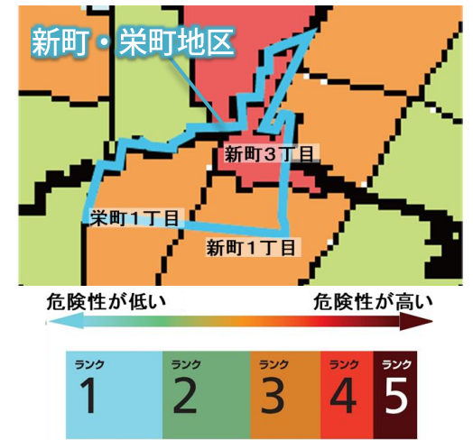
▲新町・栄町地区の地域危険度

まちづくり誘導計画と地区計画については、ニュースレター第2期第1号もご参照ください。