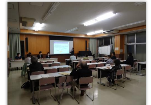
▲協議会当日の様子

*進行や開催の招集は事務局が実施し、協議会としては会長・副会長を置かずに進めていきます。