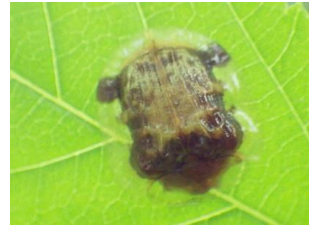
イチモンジカノコハムシ