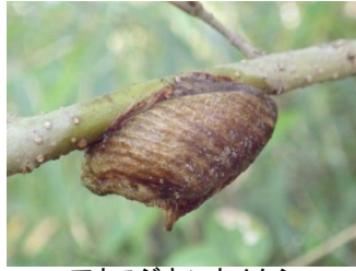
アカスジキンカメムシ