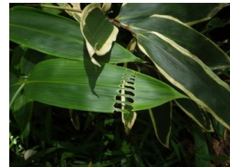
セスジノメイガ幼虫の食痕