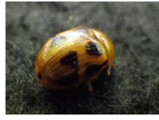
ナナホシテントウ