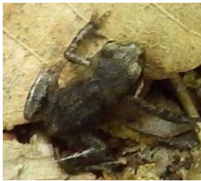
参考 トウキョウダルマガエル