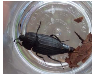
ヨツボシケシキスイ