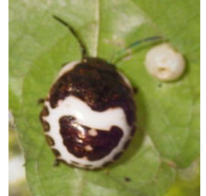
アカスジキンカメムシ(幼態)