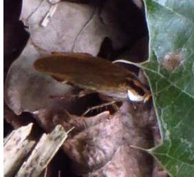
モリチャバネゴキブリ