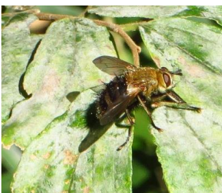
アシブトハナアブ