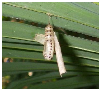
キアシドクガ(サナギ)