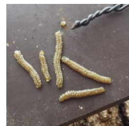
ナミテントウ・幼態