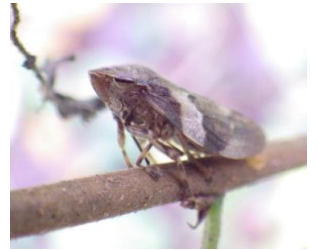
シロオビアワフキ