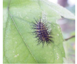
トホシテントウ・幼虫