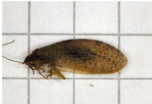
ニンギョウトビゲラ