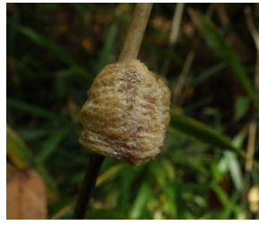
オオカマキリ卵囊