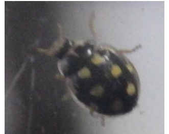
ウスキホシテントウ