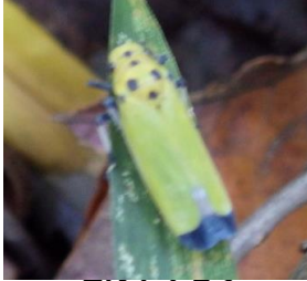
ツマグロヨコバイ