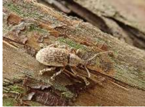
カシワクチブトゾウムシ