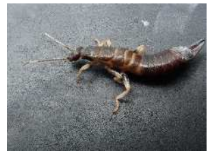
ヒゲジロハサミムシ