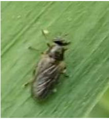
アメリカミズアブ