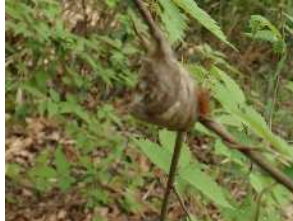
オオカマキリ・卵鞘