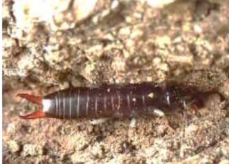
コバネハサミムシ