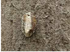
ハラビロカマキリ・卵鞘