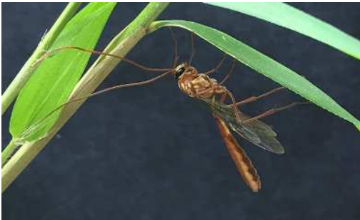
ベッコウアメバチモドキ